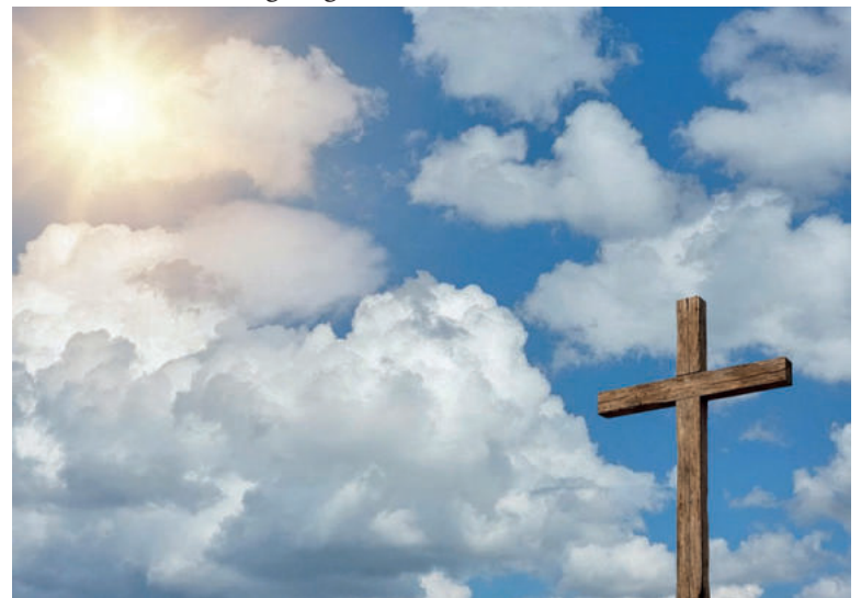
ergänzt mit KI-Generierung

Die Zahl "40" hat in der Bibel eine besondere Bedeutung: 40 Tage dauerte die Sintflut, ebenso lang zog sich Jesus in die Wüste zurück; 40 Jahre dauerte die Wanderung des Volkes Israel durch die Wüste und 40 Tage war Mose auf dem Berg Sinai. Innerhalb des österlichen Festkreises findet sich die Zahl "40" wiederum: Mit dem Aschermittwoch beginnt die 40-tägige Fastenzeit, die – abzüglich der Sonntage – mit Ostern endet. Der Christi-Himmelfahrtstag wiederum folgt 40 Tage nach Ostern. An ihm feiert die Kirche das Gedächtnis der Aufnahme Christi in den Himmel. Biblisch geht es zurück auf die Apostelgeschichte und die dort berichtete Erfahrung der Jünger, dass Jesu Sterben am Kreuz nicht den endgültigen Tod bedeutet.