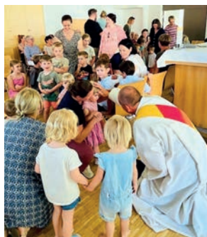
Bild: Tauferinnerungsfest 2025

Tauferinnerungsfeier am 06. Juni, um 11.00 Uhr in der Pfarrkirche